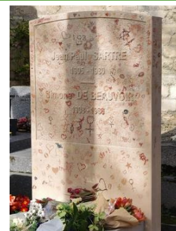
Jean-Paul Sartre Simone de Beauvoir