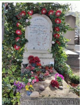
Jacques Demy-Agnès Varda