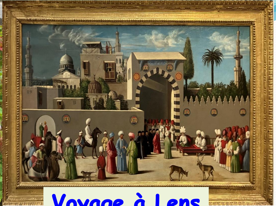
Voyage à Lens