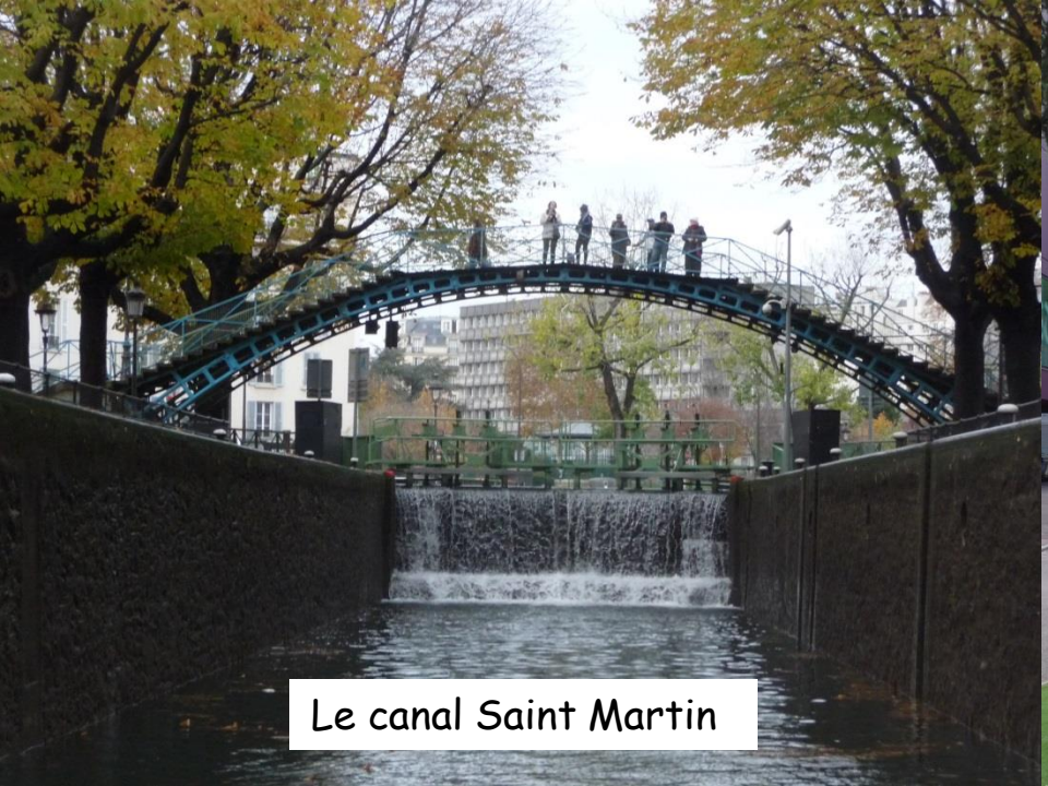
Le canal Saint Martin