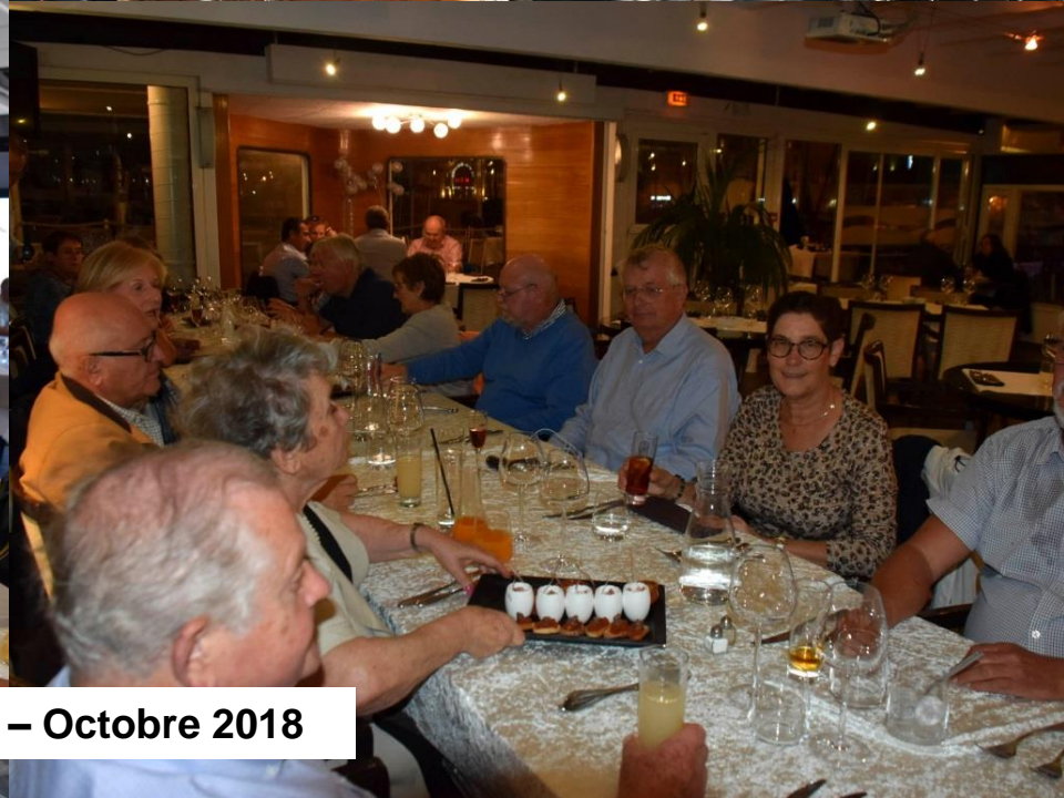
Marseille – Octobre 2018