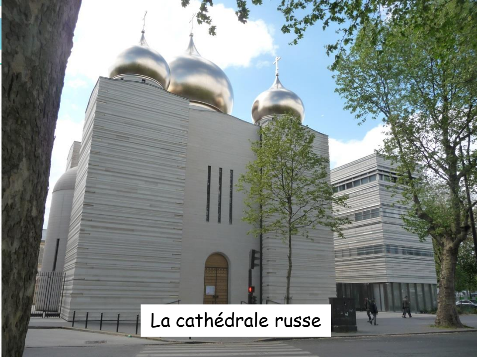
La cathédrale russe