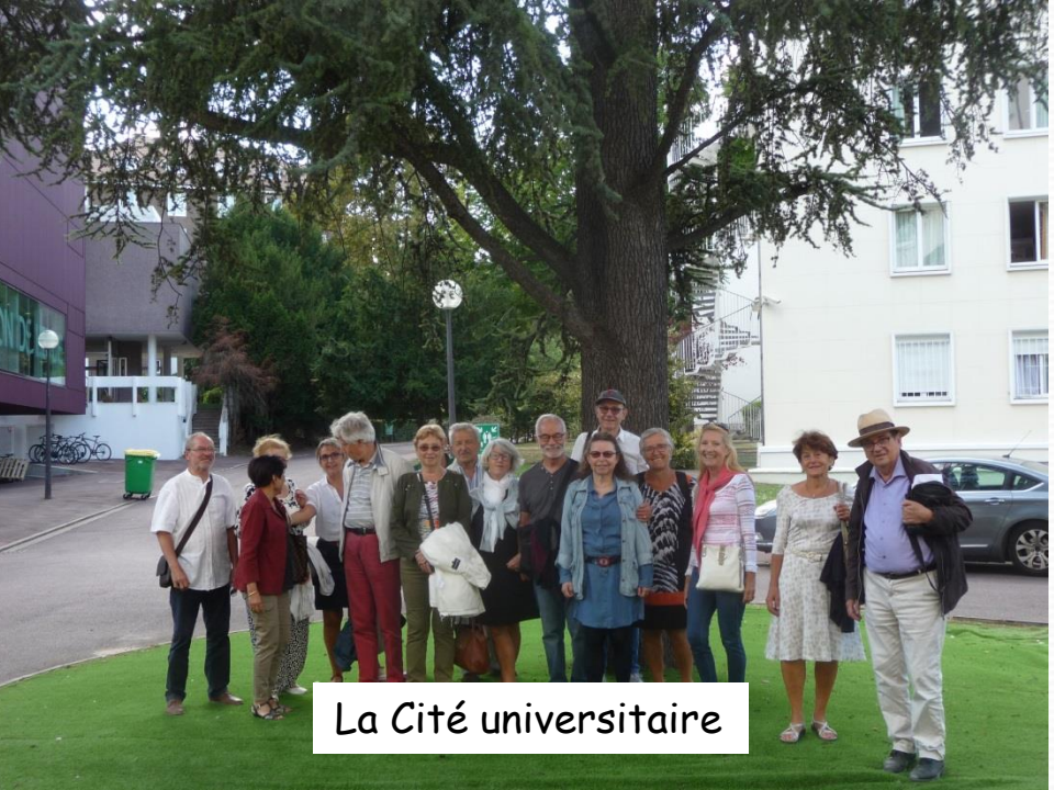
La Cité universitaire