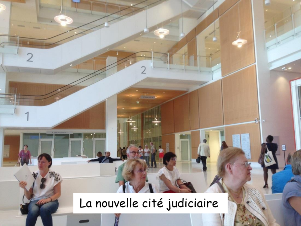
La nouvelle cité judiciaire