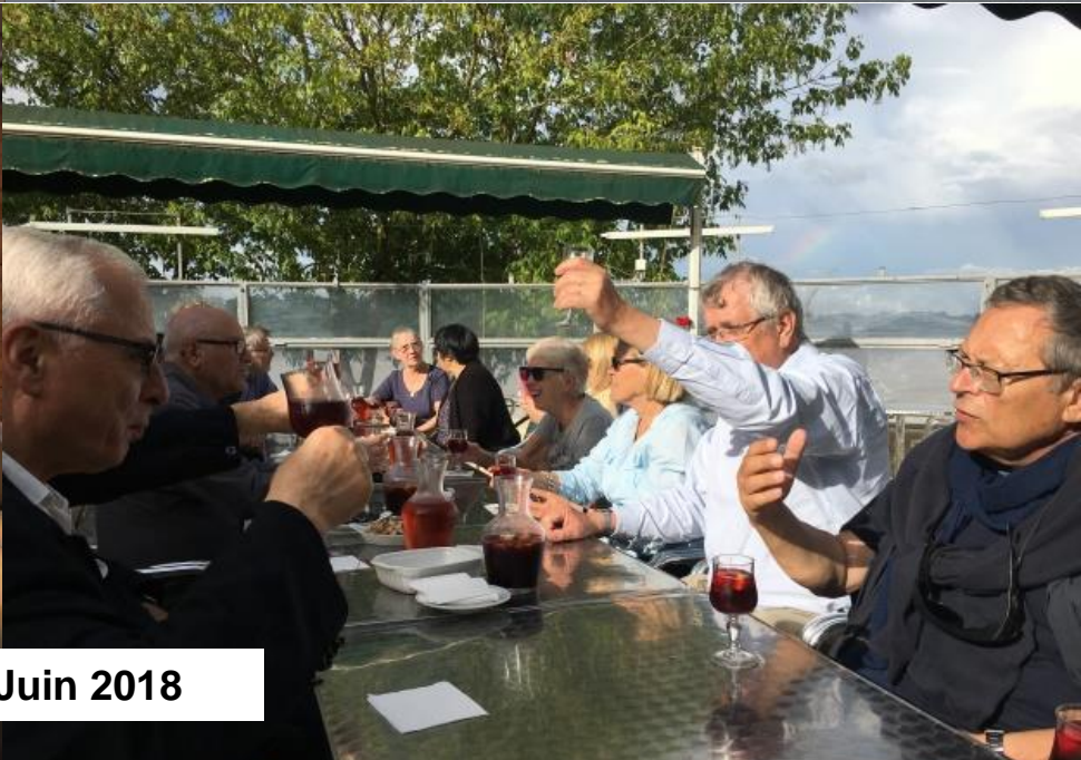
Bordeaux – Juin 2018